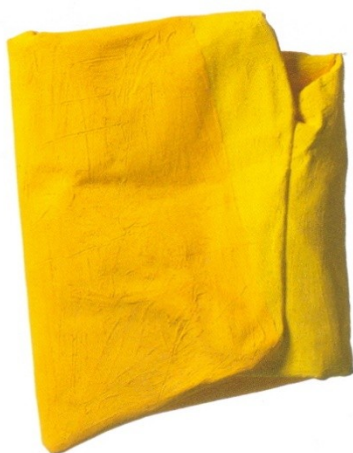
CESARE BERLINGERI Piegare il giallo, 2002