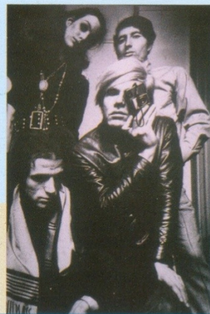
ANDY WARHOL e il gruppo della Factory, New York 1968

Durata: dal 16 al 19 ottobre Sede espositiva: Teatro augusteo Piazza Duca D'Aosta, 263 - Napoli Orario: 17.00/24.00 Biglietto: ingresso gratuito Info: Tel. 081 414306 Http: www.artecinema.com